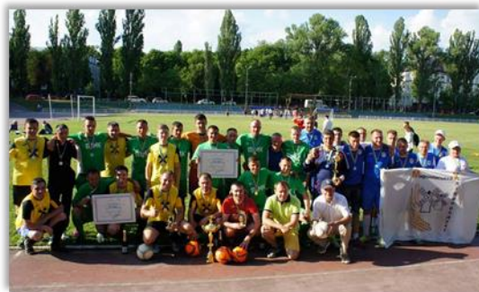
Фото – ТУТ , Відео – ТУТ

Текстова трансляція – 1 день ТУТ , 2 день – ТУТ